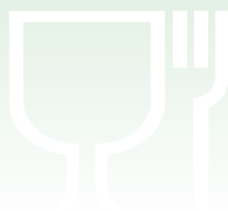
1 Lebensmittel Silikon